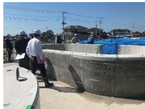
活用モデル工事の現場監査の様子

に「品確法基本方針」の一部変更があり、発注者の努力義務として制度化されました。今後、本制度の適用工事が拡大していくものと考えられます。MSA では引き続き公共工事の品質確保と生産性の向上などに寄与するよう積極的に取り組んで参ります。